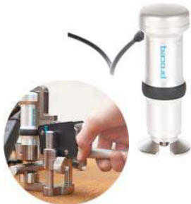
Dispositivo Equotip 550 Portable Rockwell e alicate especial para uso do dispositivo (detalhe)