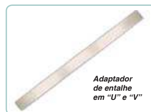
Adaptador de entalhe em "U" e "V"