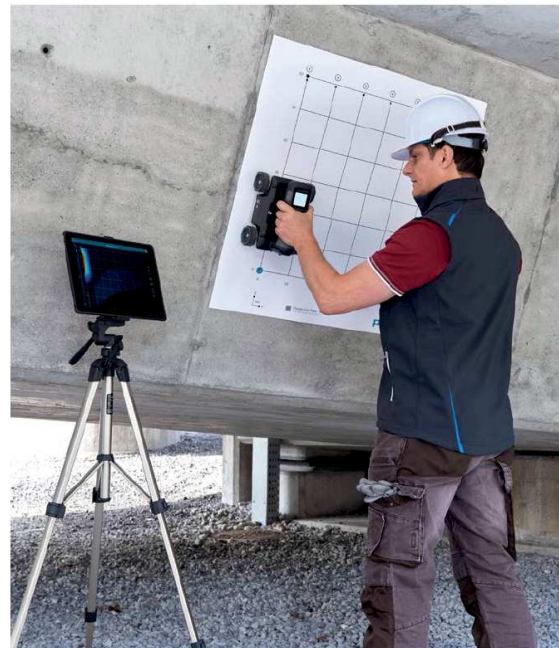
GPR LIVE trabalhando no modo de medição Line Scan

4.853.800 - Equipamento para avaliação não destrutiva de concreto GPR Live Basic 4.853.810 - Equipamento para avaliação não destrutiva de concreto GPR Live Pró