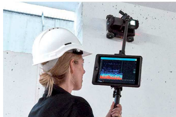
GPR LIVE combinado com a haste telescópica com suporte para tablet