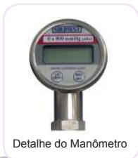
Detalhe do Manômetro

Conjunto para Determinação do Máximo Peso Específico (Rice Test) para determinar a máxima gravidade e densidade específica em misturas betuminosas de pavimento (RICE TEST) composto de: - Recipiente tronco-cônico metálico para aplicação de vácuo com tampa e manômetro de pressão residual absoluta, mesa de agitação orbital de bancada com controlador de velocidade e garras de fixação, conexões, mangueiras de silicone, torneira de vidro com 03 vias, 03 frascos Kitazato, 02 suportes de madeira e bomba de vácuo. Alimentação 220V. Obs.: O recipiente tronco cônico metálico fornecido foi projetado para também permitir a extração de vácuo de amostras cilíndricas usadas no ensaio de Danos por umidade induzida. Conforme normas: ASTM D 2041; AASHTO T 283 e T 209.